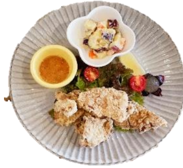
からあげランチ 750円 (スープ+ライス付)