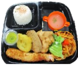
お子様ランチ 500円 (スープ+ライス+カルピス付)