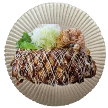
オムソバ 750円 (スープ+からあげ2個付)