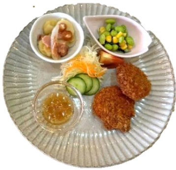
日替わりランチ 600円 (スープ+ライス付)